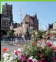
Une ville verte