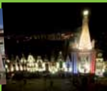
Ville de lumières