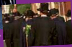
Les charitables de Béthune