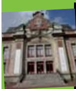
Le théâtre municipal