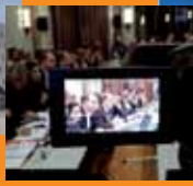
Une ville moderne et connectée