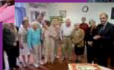
Une place pour tous