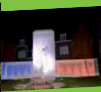
Un patrimoine riche