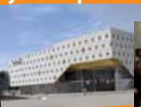
Cinéma les Etoiles quartier de la gare