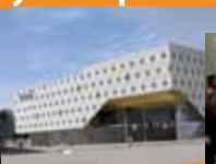
Cinéma les Etoiles quartier de la gare