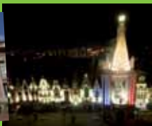
Ville de lumières