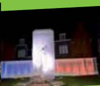
Un patrimoine riche