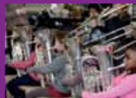
Cap sur l'éducation