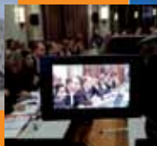
Une ville moderne et connectée