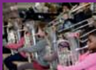
Cap sur l'éducation