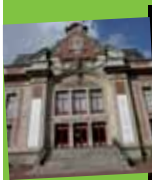
Le théâtre municipal