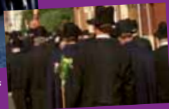
Les charitables de Bethune