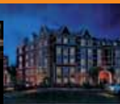
Des projets de nouveaux logements