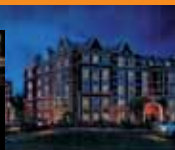
Des projets de nouveaux logements