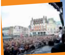
Des fêtes populaires